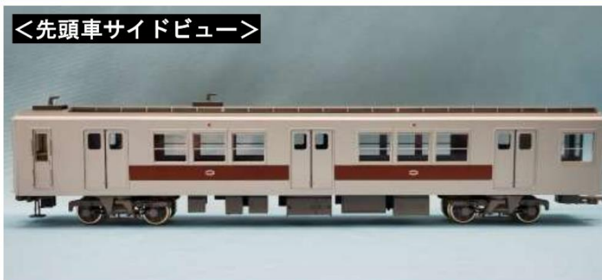
<先頭車サイドビュー>

★前後に二つ並んだアンテナと屋根上モニターの雰囲気が60系らしさを醸し出しています。