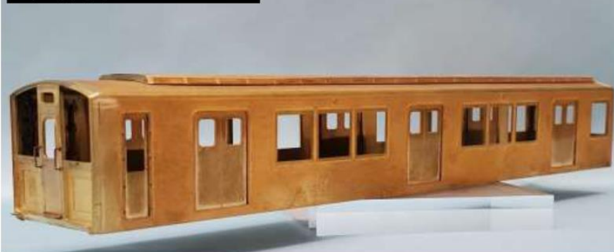
＜先頭車組立サンプル＞